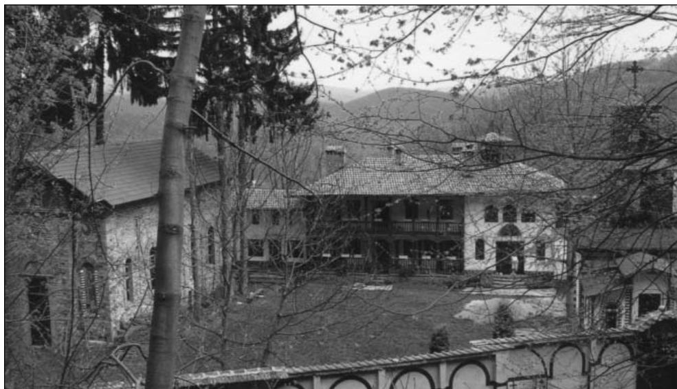
Манастирски комплекси от Софийската Мала Света гора